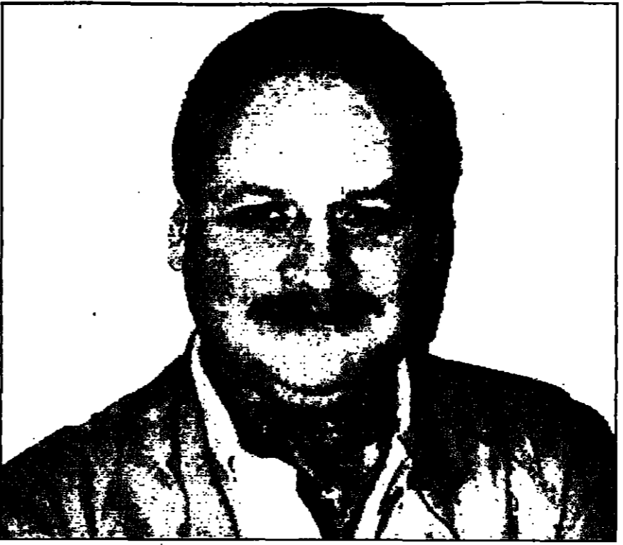
أخر صورة التقطت لكارلوس في منزله بحد السجن الفرنسي قبل محاكمته

باريس - القدس العربي - عشية بدء محاكمة الليش راميريز سانشيز الشهير - كارلوس، في باريس (اليوم)، عرضت لآلة الفرسنة الشاذية (F2) برنامجا خاصا حول حياة امين ضمن بوتامجا الاسويجي الشهير ميموث خاصه، الجزء جيل ووجونشاي الذي انتقل الى كاراكاس واول اخرى متفحفا خطى هذا الرجل الذي تملك عنه وسائل الاعلام انه ظل طيلة عشرين عاما العدو رقم واحد لكل أجهزة مكافحة الارهاب في العالم.